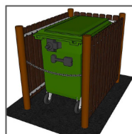
Modèle pour 1 bac 660L de profil