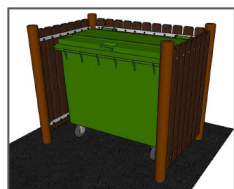
Modèle pour 1 bac 660L de face